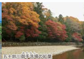
五十鈴川みたらし御手洗場の紅葉