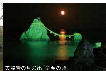
夫婦岩の月の出(冬至の頃)