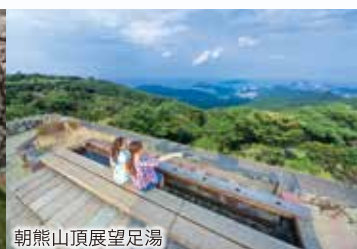
朝熊山頂展望足湯